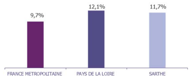
GRAPHIQUE POIDS DES OBLIGATIONS D'EMPLOI SUR LA DEFM TOTALE